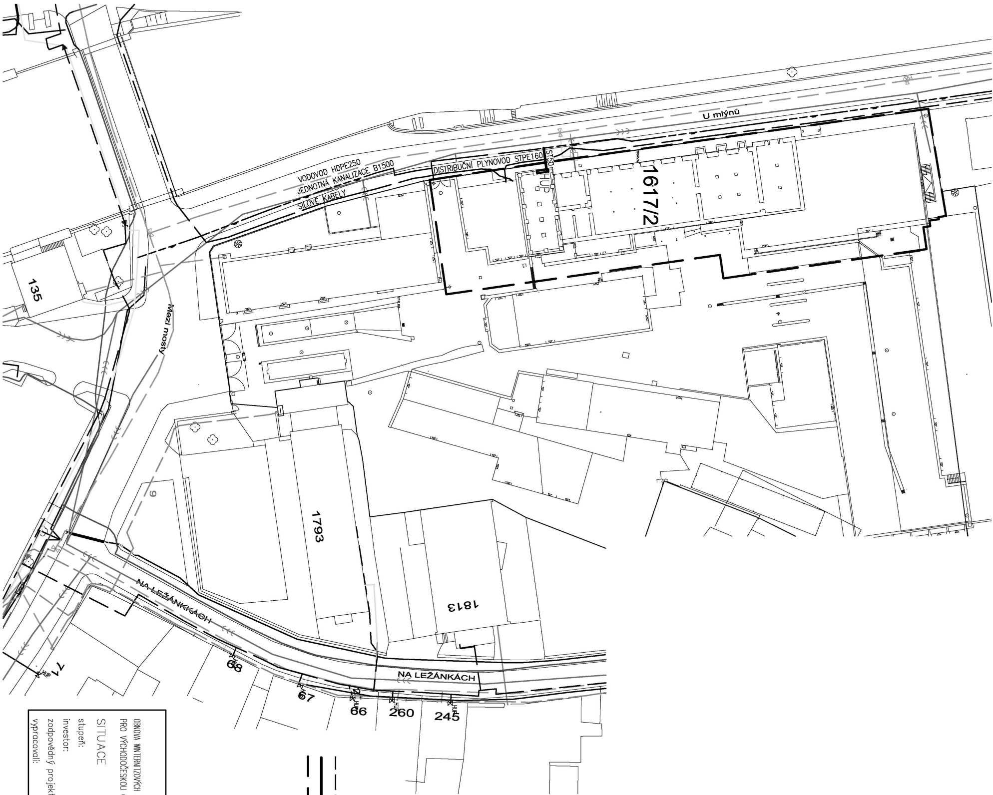
SITUACE M 1:500